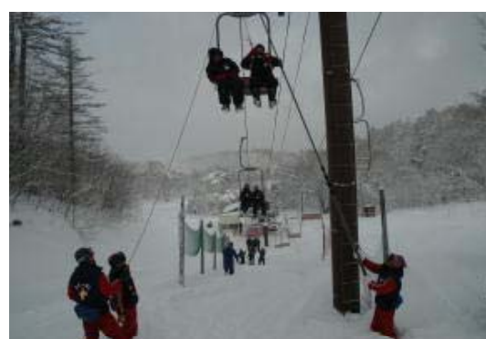
スキー場救助訓練