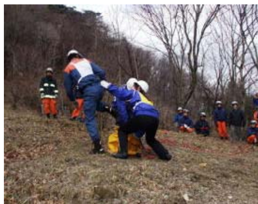
ロープウェイ合同救助訓練